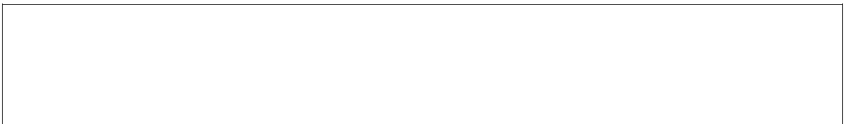
Abbildung 1: Name der Abbildung