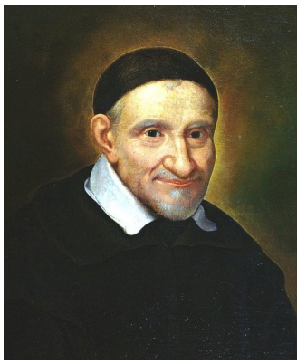
Vinzenz von Paul 1581 - 1660

Unser Umgang miteinander ist von Respekt und Wertschätzung geprägt, in Anlehnung an unsere Leitlinien und Leitgedanken der barmherzigen Schwestern des Hl. Vinzenz von Paul.